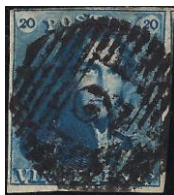
Epaulette O.C.B.nr. 2