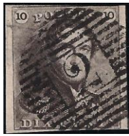
Epaulette O.C.B.nr. 1